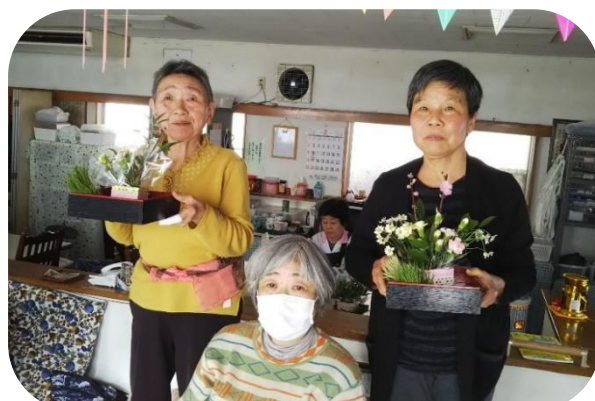
フラワーアレンジメント教室での1コマ

*現在、「ほっとウエーブ」は、新型コロナウイルスの影響で休止しております。今後は、ギター・ハーモニカ演奏、オカリナ演奏、手芸、健康マージャンなどを予定しておりますので、再開になりましたらチラシ等でお知らせ致します。皆さまとの再会を心待ちにしております。